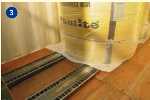
Levantamento das mercadorias directamente do chão