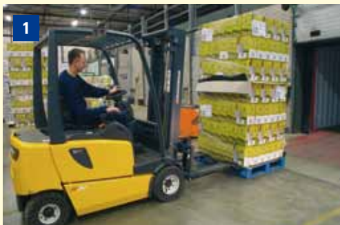
Os RollerForks® são facilmente aplicados em qualquer empilhador.

Os RollerForks® podem ser aplicados à maior parte dos empilhadores de garfos com o porta-garfos FEM incluindo os empilhadores eléctricos leves. Os produtos em caixas e embalagens de cartão, mercadorias ensacadas, FIBC, etc podem ser transportados com RollerForks® quando colocados numa folha intermédia. Uma vez que não são necessários componentes hidráulicos nem lubrificações, os RollerForks® são especialmente adequados para as indústrias alimentar, química, dos bens de consumo, das bebidas e farmacêutica. Também é possível colocar uma carga com folha intermédia numa paleta convencional para transporte e armazenamento interno.