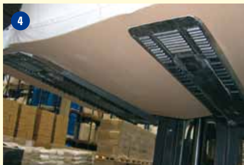
Durante o transporte, a carga é fixada nos garfos.