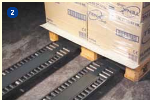
Utilizados como um par, também podem transportar paletes normais.